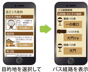
目的地を選択して バス経路を表示

目的地を選ぶと、バスを利用した経路を表示します。また、乗車するバスが近づいた時や、降車するバス停に近づいたらお知らせします。